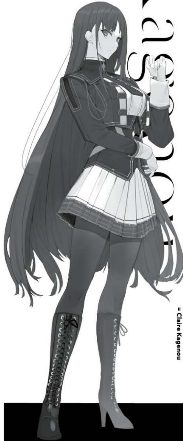
= Claire Kagenou

Cid’s older sister, the golden child of the Kagenous. She contracted the “possession” as a child, which Cid secretly cured. The Knight Order has tried to recruit her on account of her superb sword skills, but she doesn’t want to be separated from her brother out of concern for his well-being. Thanks to a certain incident, she’s come to believe she has special powers.