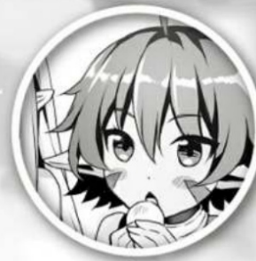
Alma Elder Dwarf Girl