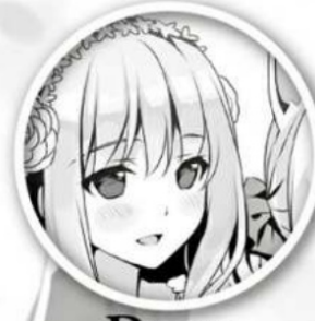
Dryas High Class Spirit of the Spirit Folk Village