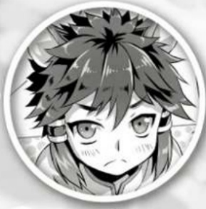
Arslan Werelion Boy