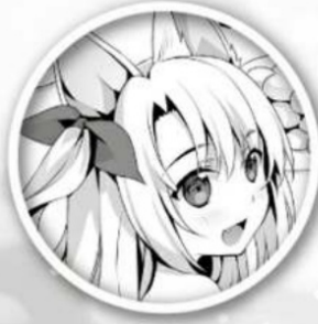
Vera Silver Werewolf Girl & Sara's Sister