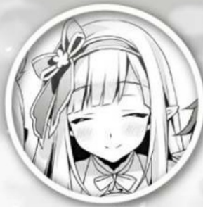
Orphia High Elf Girl