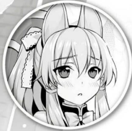
Latifa Werefox Girl & Former Slave. Reincarnated from another world and fondly calls Rio "Onii-chan."