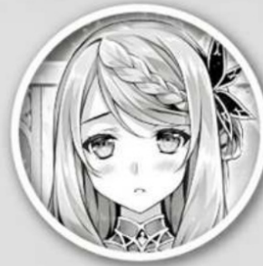
Flora Beltrum Second Princess of the Kingdom of Beltrum