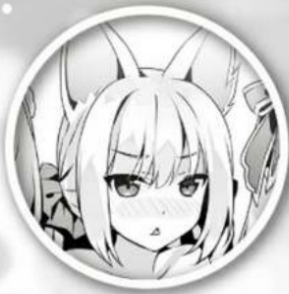
Sara Silver Werewolf Girl