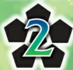
Illustration by Haruyuki Morisawa