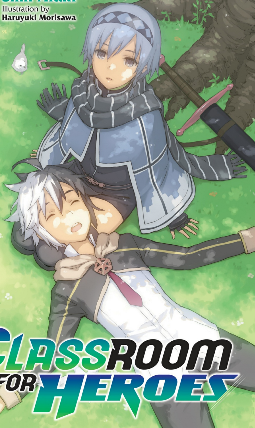
Illustration by Haruyuki Morisawa