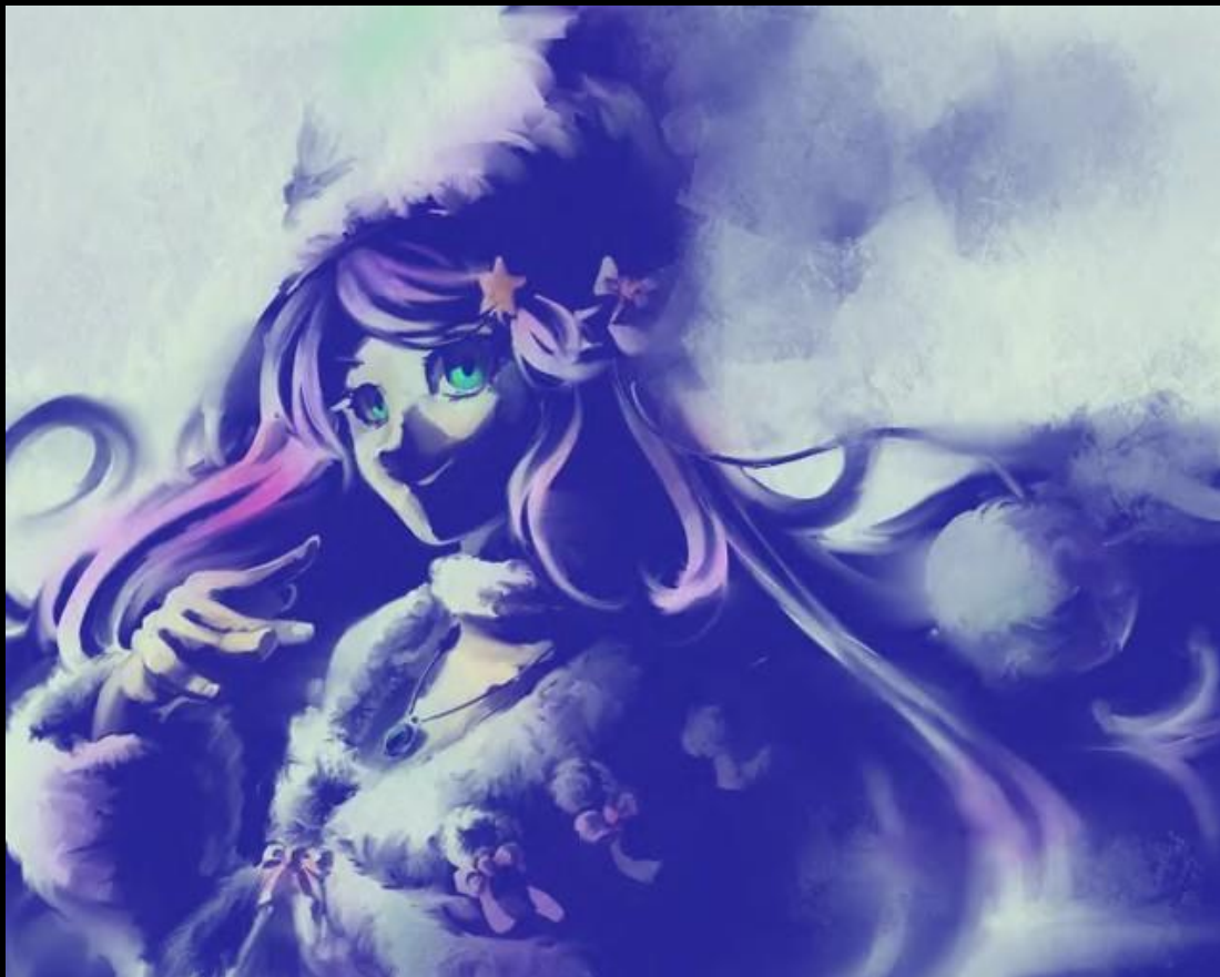
Artiste du fan-art : 馬刺・馬鳥・くろみろく白地

Après avoir réaffirmé leur détermination, Subaru et Anastasia descendirent vers le hall de réception.