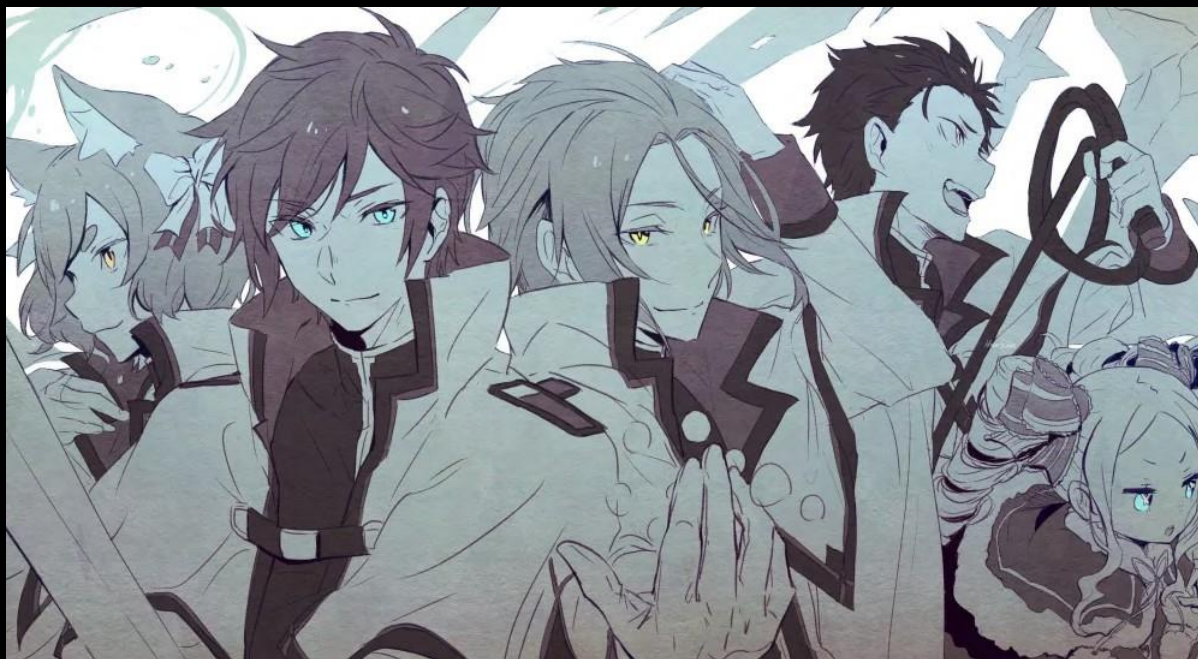
Artiste du fan-art : Harusabin

Anastasia : “Vous êtes revenu bien tôt.”