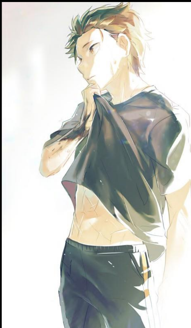
Artiste du fan-art : Harusabin

Vingt-cinq abris par rue, soit un total de cent abris dans toute la ville de Pristella.