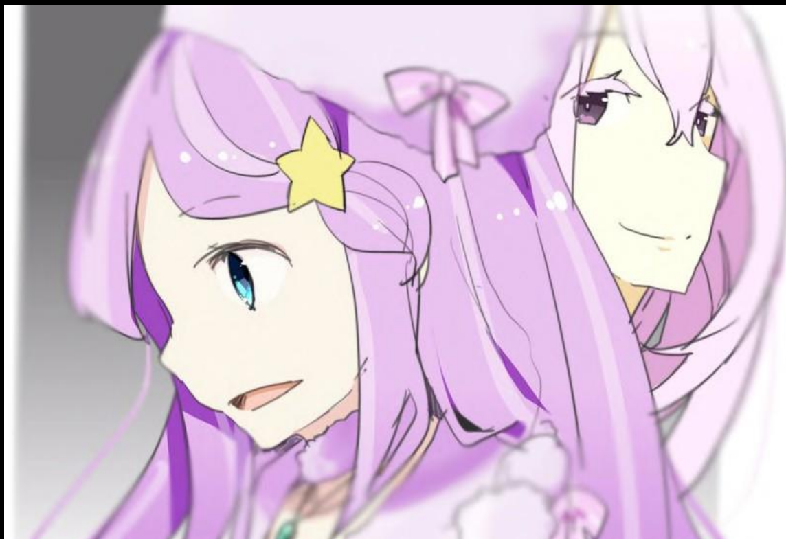
Artiste du fan-art : ???

Alors que Subaru regardait cette chose, les yeux écarquillés de stupeur, il oublia momentanément de respirer.