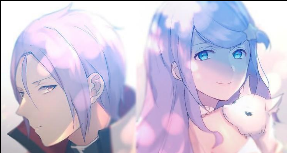
Artiste du fan-art : takana