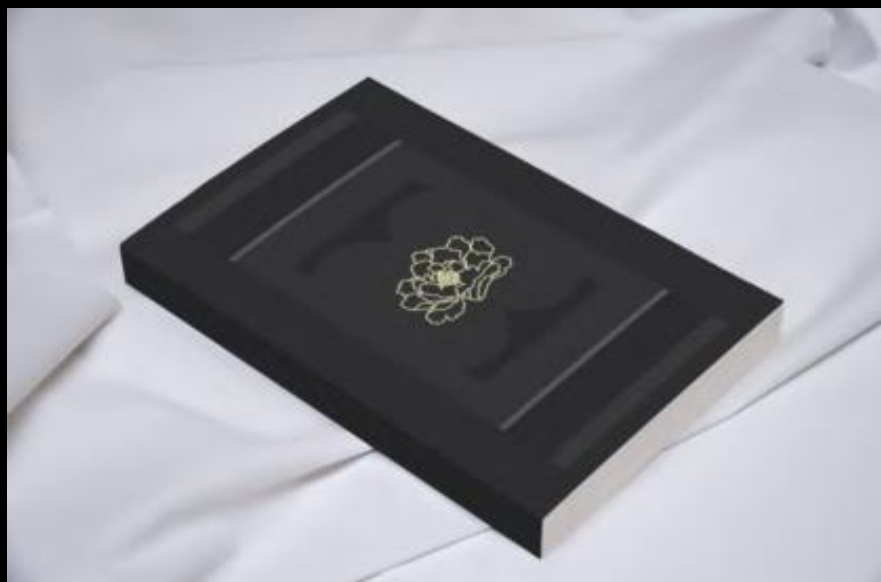
Artiste du fan-art : 뷁

Tout le monde dans la salle fut plongé dans un état de choc, après qu’Otto ait lâché cette bombe, en levant la main.