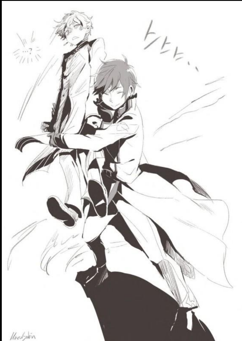
Artiste du fan-art : HaruSabin

—Lorsque le halo s’estompa et que Subaru retrouva la vue, l’état de la cathédrale avait changé du tout au tout.