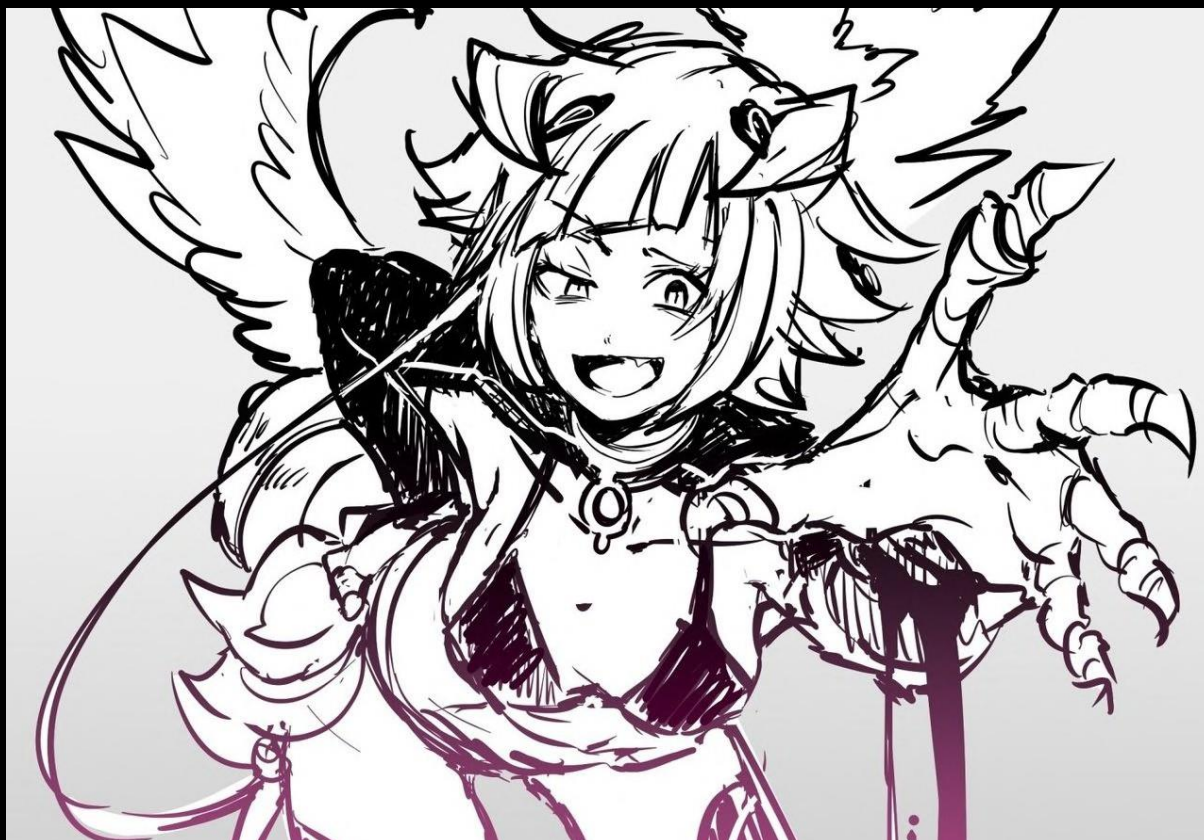
Artiste du fan-art : Owari

Al : “Bien que je vienne à peine de te saluer, je suis d’une humeur massacrate aujourd’hui—avant que je ne meure, dépêche-toi de foutre le camp d’ici. Mollusque.”