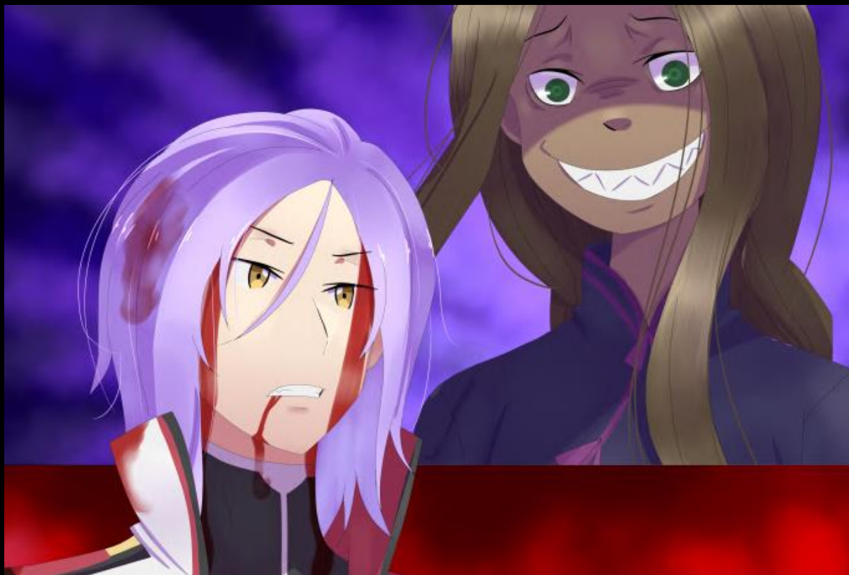
Artiste du fan-art : Ringo

(Avant de commencer le chapitre il est conseillé de lire cette histoire annexe pour avoir du contexte : “La deuxième encyclopédie prudente de Joshua Juukulius”.)