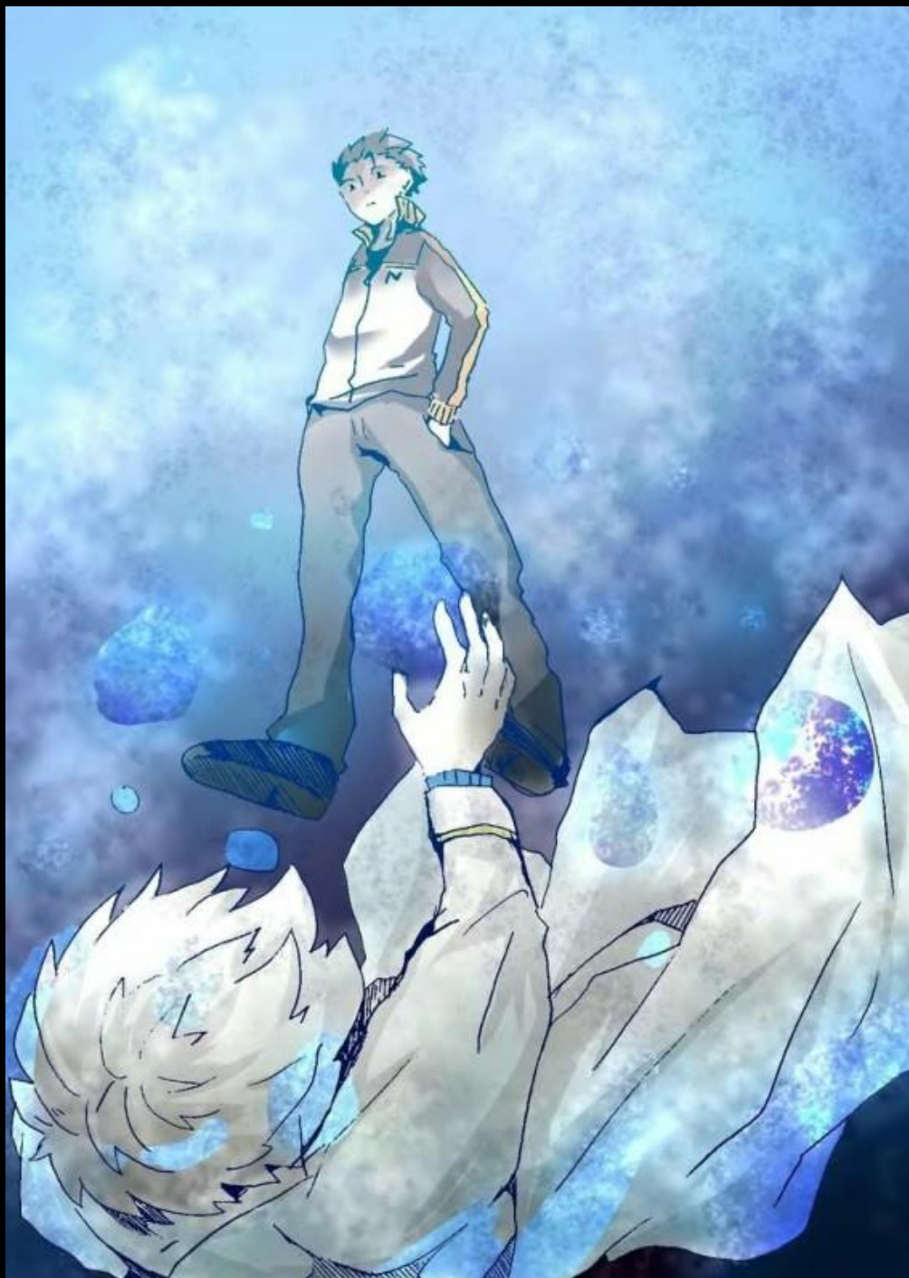
Artiste du fan-art : 吉川みら

Un total de cinq stalactites entravaient les extrémités de Regulus, utilisant son corps comme point de congélation alors qu'il plongeait dans le canal. Immédiatement, une main magique et glacée s'étendit vers l'avant, se centrant sur l'endroit où Regulus était tombé, retraçant l'écoulement de l'eau—le canal fut transformé en un tombeau glacé, sans même une seule brèche.