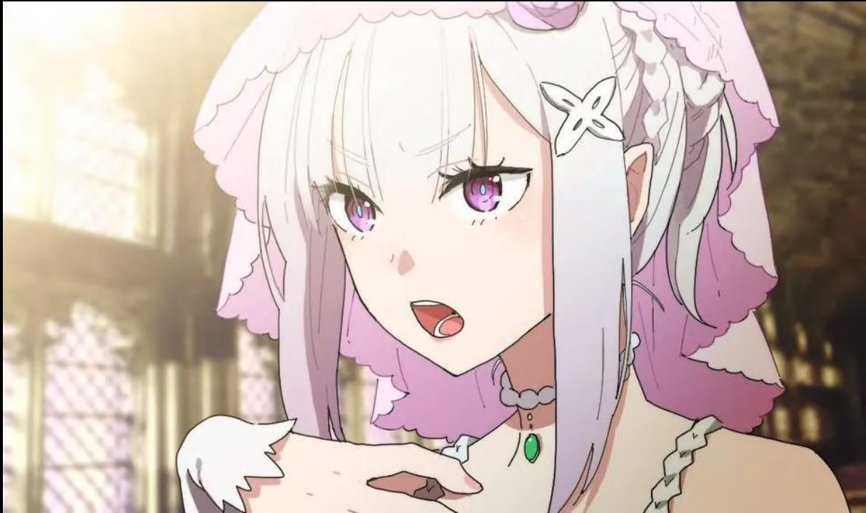
Artiste du fan-art : わか