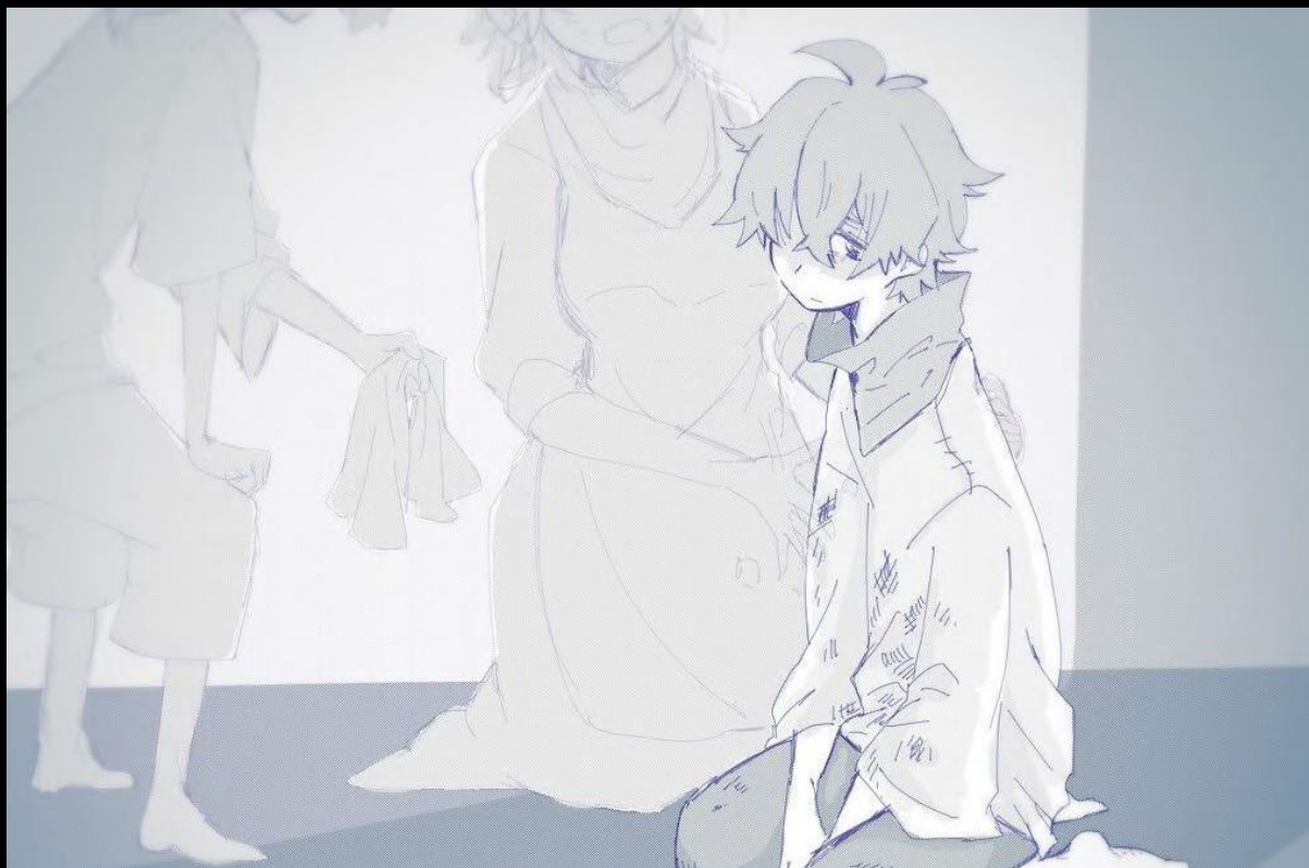
Artiste du fan-art : ???