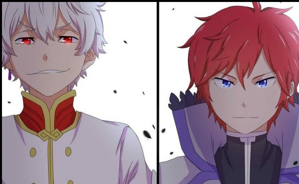
Artiste du fan-art : kawakun