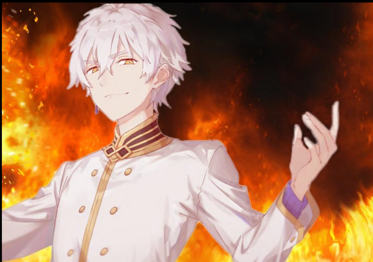
Artiste du fan-art : ???