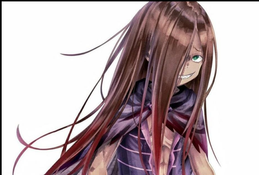
Artiste du fan-art : SakuraLCE