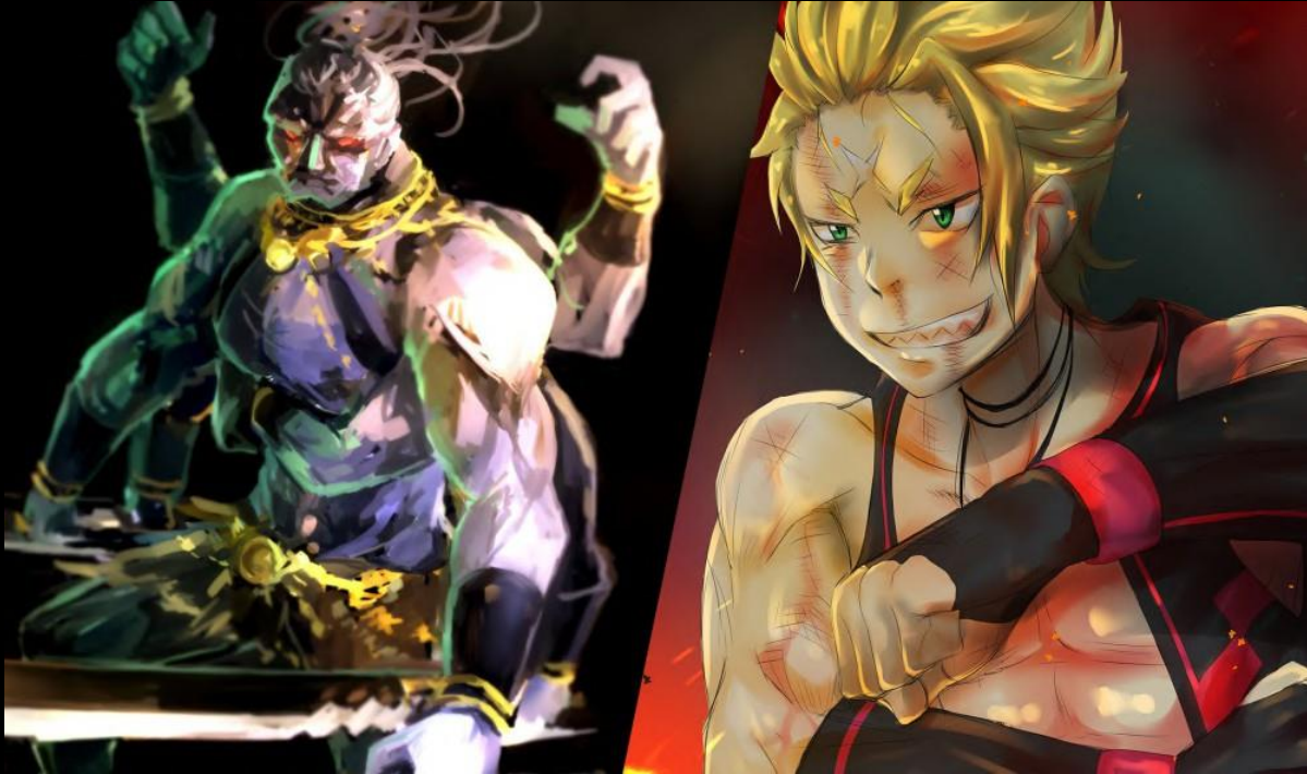
Artiste des fan-arts : nogbeanhood et haribote

—Les légendes du dieu de la guerre, Kurgan, étaient largement répandues dans l’Empire de Vollachia.