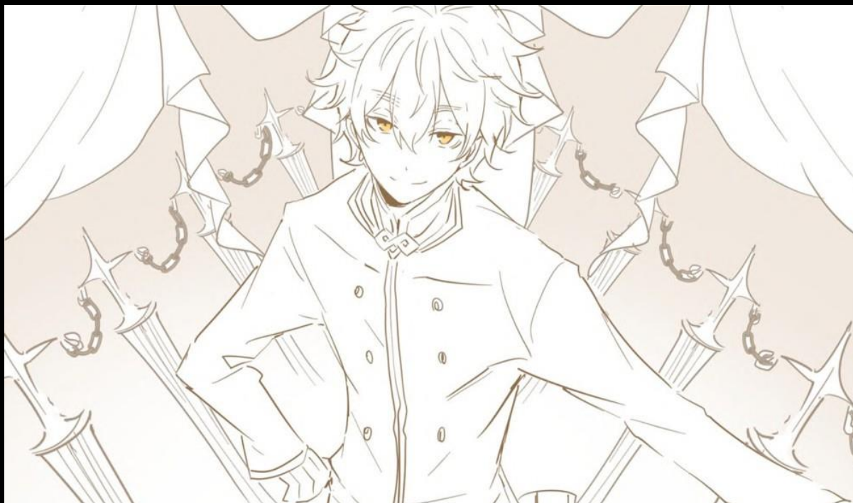
Artiste du fan-art : Owari

—L’Autorité de l’Avarice associée à son nom d’étoile, le véritable visage de son Invincibilité.