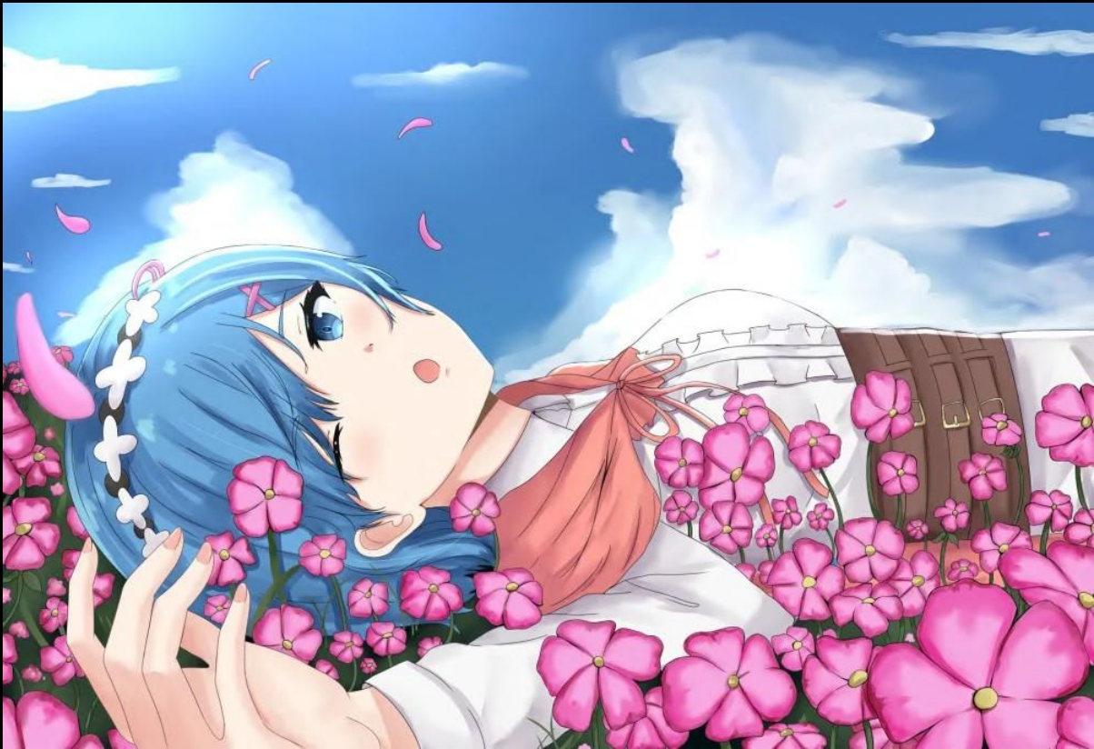
Artiste du fan-art : Synndev

—Dès que le panache de fumée se dissipa, Ram ressentit un rare sentiment d'impuissance.