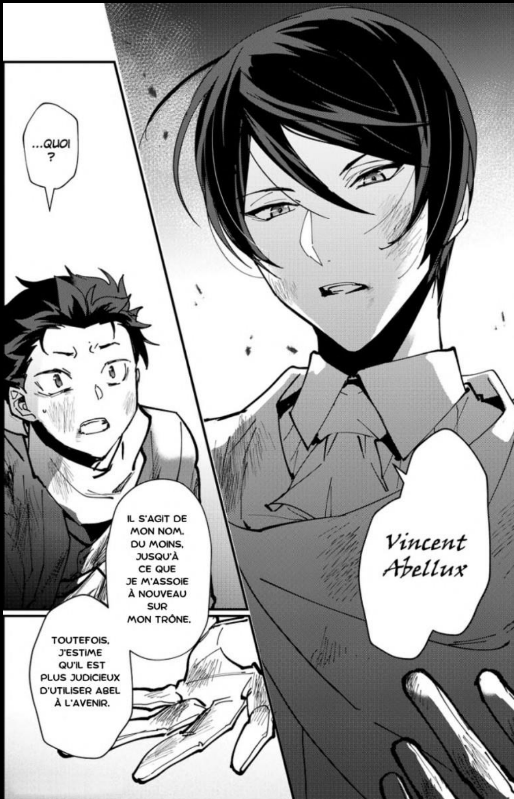
Artiste du fan-art : Roikumama

En outre, si elle était capable d'afficher une attitude joyeuse, même quand il mourait, tenait au fait que leurs points de vue sur la vie et la mort étaient différents.