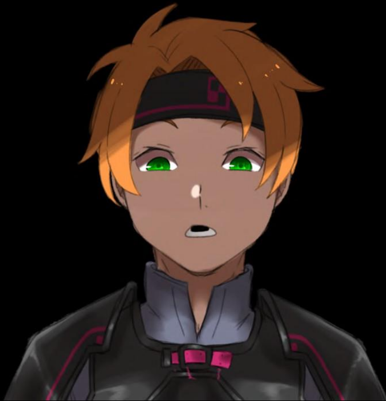
Artiste du fan-art : Negi