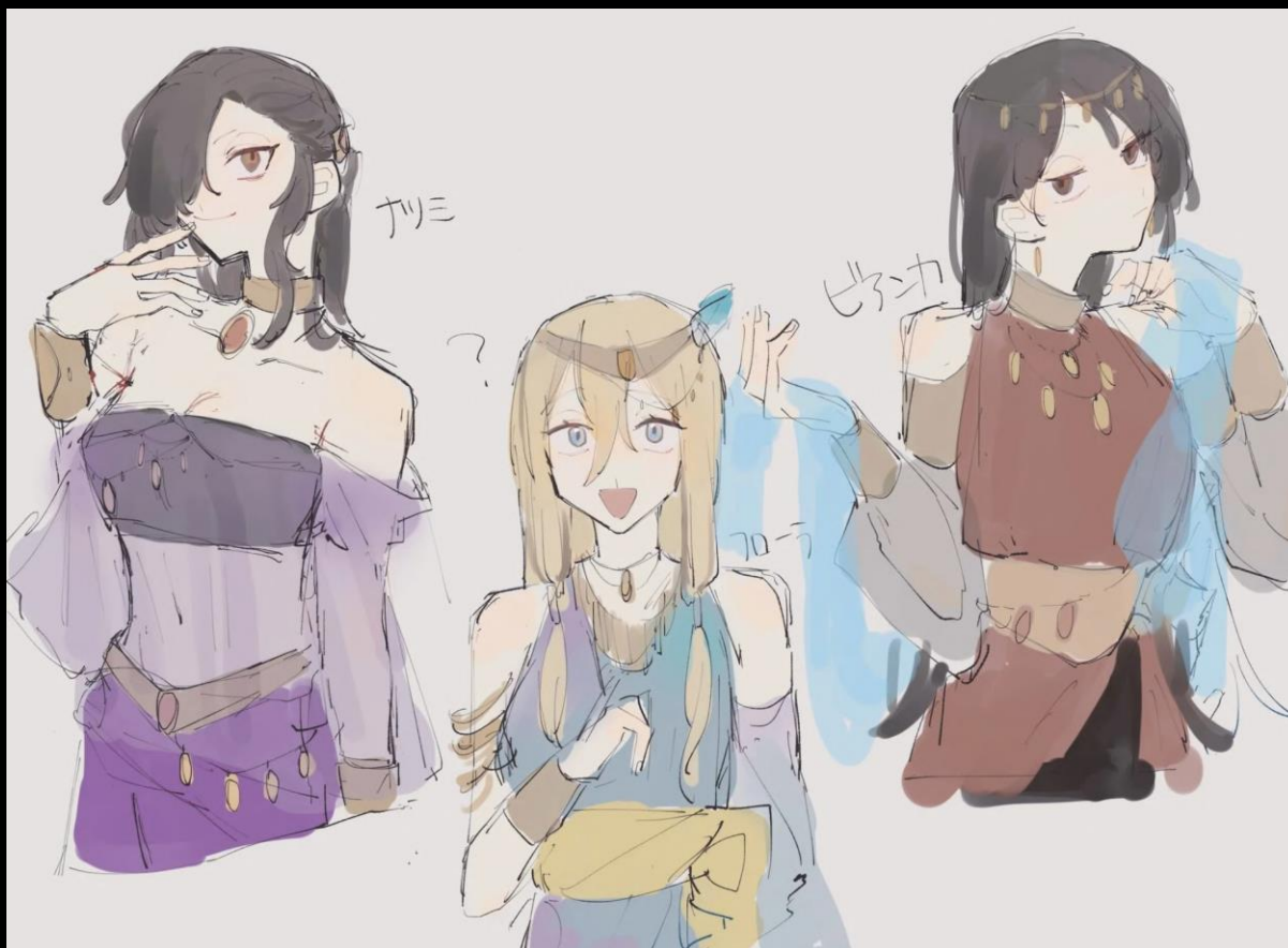
Artiste du fan-art : kann_1000