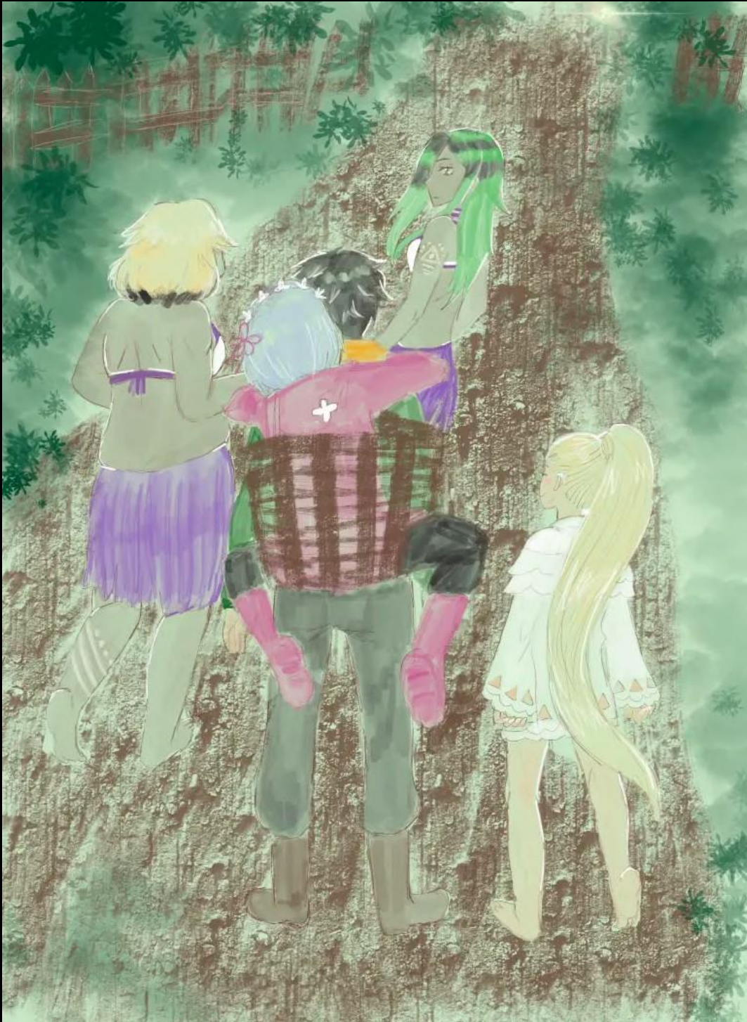
Artiste du fan-art : Pabobingu