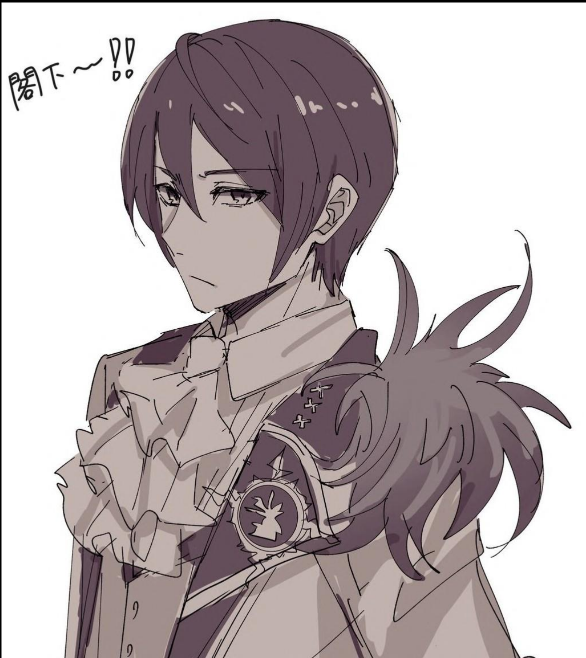
Artiste du fan-art : hatume_73

—L’homme demeurait immobile, étalé sur le sol raide.