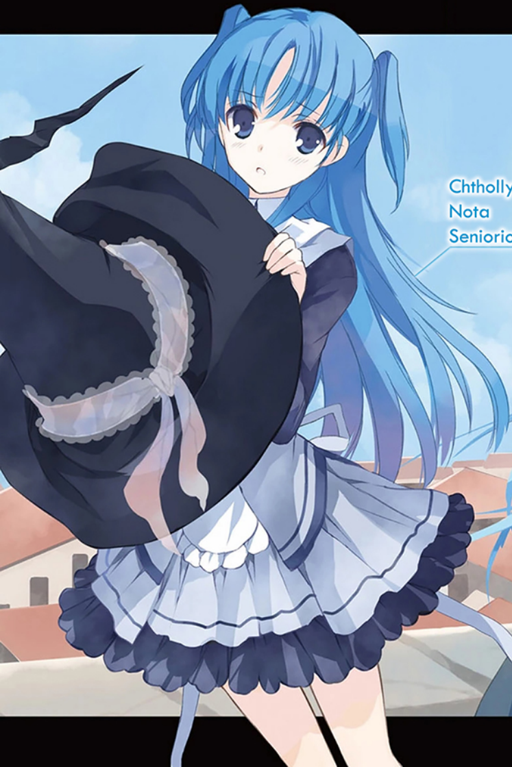
Chtholly Nota Seniorious