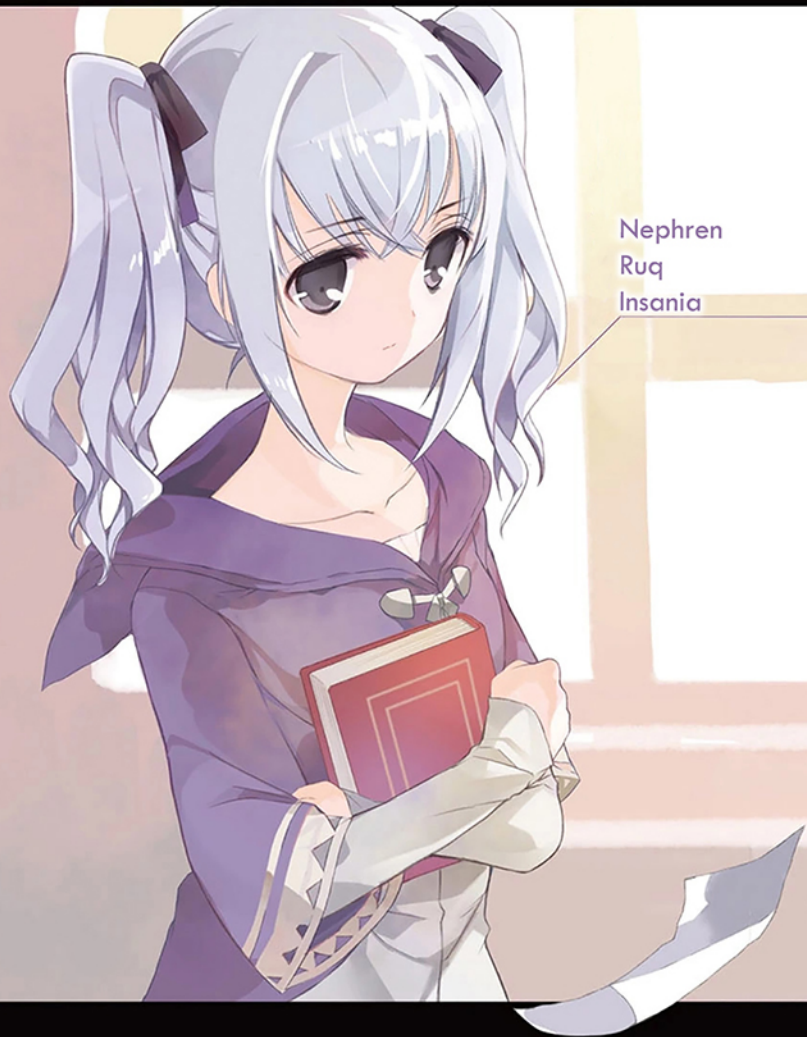
Nephren Ruq Insania

« Je n'ai rien fait pour mériter tes remerciements. »