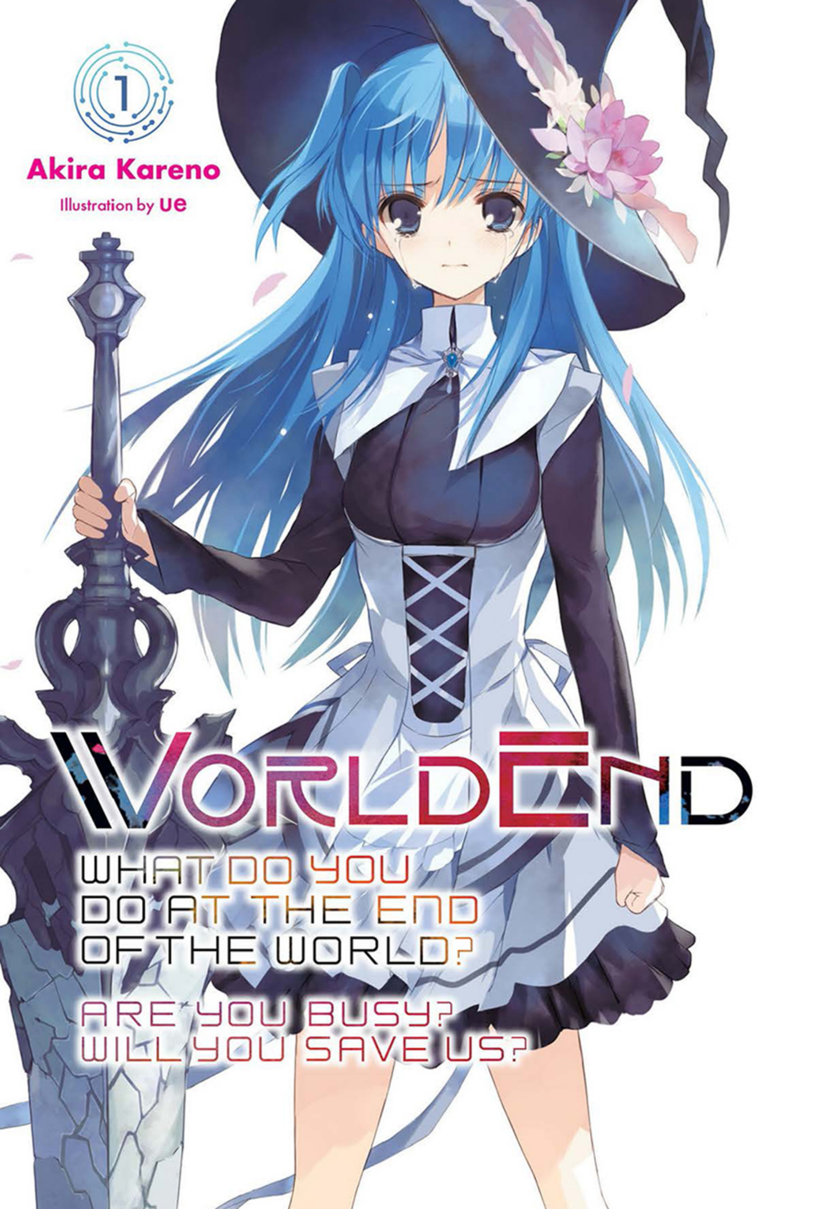
Illustration by UE