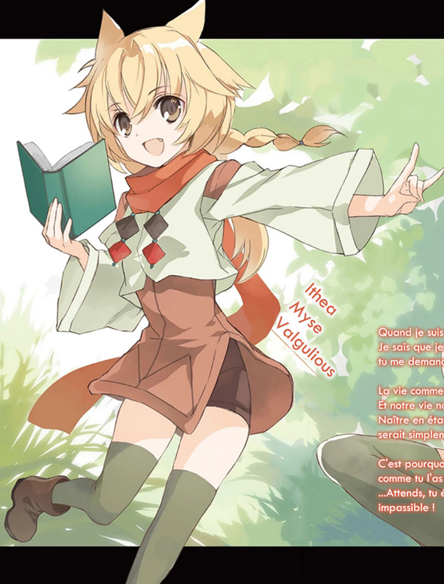
Ithea Myse Valgulious

« Te battre dans un état si lamentable, c'est mettre ta vie en danger. C'est un peu bizarre que tu fasses ça sans arrière-pensée »